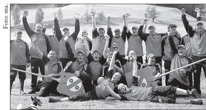
Riesige Freude nach dem Aufstieg von Krauchthal-Hub.

Weitere Fotos der Aufsteiger unter www.krauchthal-hub.ch .